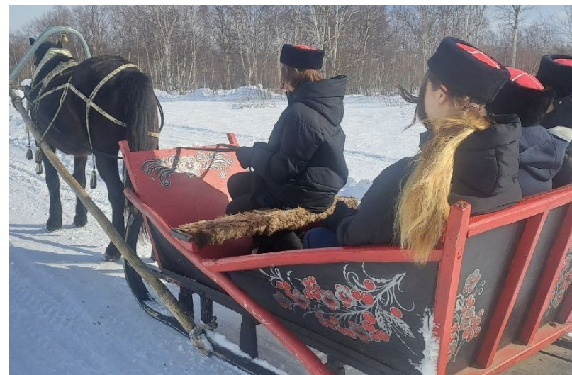
Кадеты на занятиях Конной подготовки