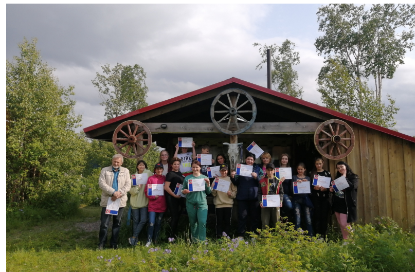
Ученики Школы конного туризма