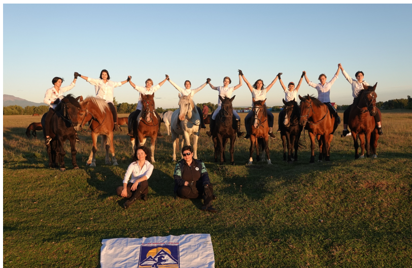
Ученики школы конного туризма