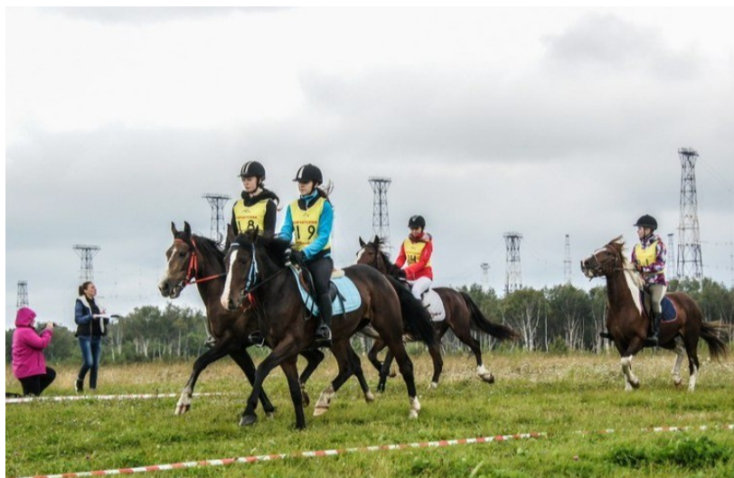
Конные игры, пос. Разодольный