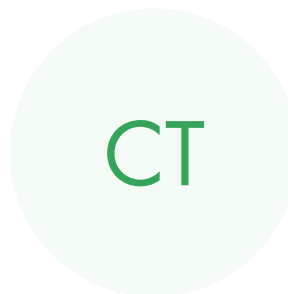
Созыкина Таисия Михайловна

Уроки конной подготовки для кадетов-казаков